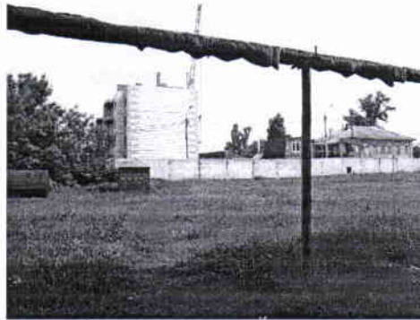
фото № 4