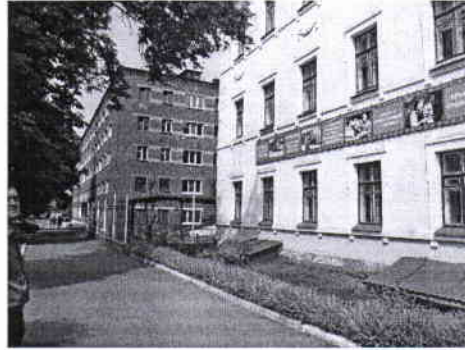
фото № 2