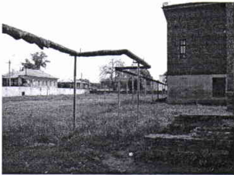
фото № 3